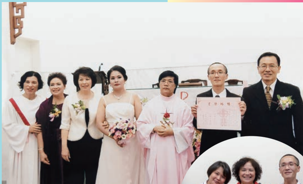
▲因著這些人的陪伴，俊強結婚了，開店了。

我是在監所受洗的，因為我聽了很多見證，說他們信主後不但戒了毒，也開始過新生活，這很吸引我，所以我想，我也可以做到。但