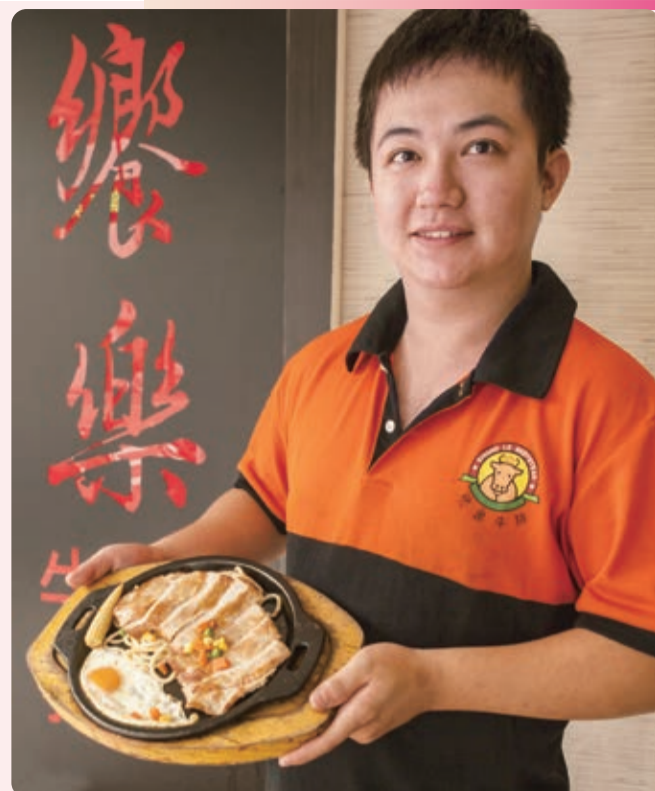
▲初次來的客人，若可以吃牛肉，推薦吃紐約客牛排；不能吃牛肉的，就推薦吃松阪豬排。

拉吧。店家不惜成本，提供高級杜老爺冰淇淋、軟法麵包，而且除了咖啡機，還多了果醋機和泡茶機，令人意外的是還提供剉冰。不僅如此，店裡提供了一個寬敞整潔和空調良好的環境，吃牛排可以不擁擠，還可隨意併桌，很適合團體或家庭聚餐，不但吃得美味，還吃得舒適。「紐約客牛排」是店裡的招牌，足足有12盎司大，剛上桌就看出牛排還超出鐵板，一入口就嚐出它的軟嫩和香。建議前往動物園或深坑老街的旅人，可以先聞香下馬，吃道色香味俱全的牛排。