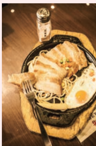
◀很少有牛排館裡賣「松阪豬排」，是店裡唯一沒有醃過的肉，適合吃原味，撒點玫瑰鹽吃起來更美味，對不能吃牛肉的客人多了一種高級的選擇。