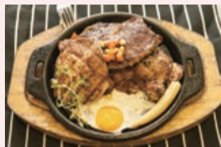
▲「三個願望」：「沙朗牛排」軟嫩富嚼勁；「香蒜雞腿肉」去骨，煎得酥脆脆；「碳烤豬排」里肌肉先醃後烤，肉質甜美，一次滿足肉食主義者。