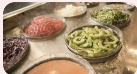
▲生菜沙拉吧還提供少見的苦瓜、小豆苗，足見老闆的誠意。