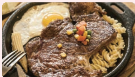
▲「紐約客牛排」用的是牛的前腰背部，少筋，軟嫩略帶嚼勁，完全沒有難咀嚼的問題，特別推薦給牙齒不好又愛吃牛肉的人，是店裡面積最大的牛排。