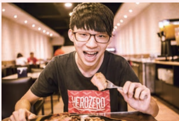
▲有客人是吃到這裡的紐約客，以後就常常上門。