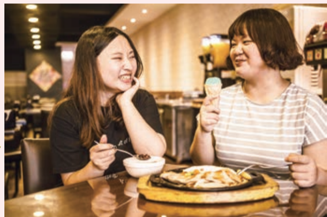
▲提供高級的杜老爺冰淇淋，還有炎夏令人歡迎的剉冰。