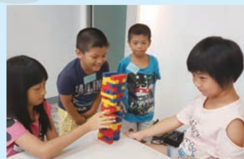
▲活潑好玩的益智桌遊

◆萬金靈糧福音中心 ◆地址：新北市金山區中山路275號 ◆電話：(02) 2408-2635、0937-994420