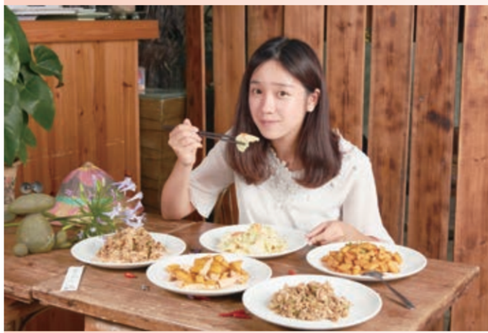
▲不同的季節有不同的野菜推出，是個很理想的野菜餐廳。

陽金公路上，台二甲線14.3K處，有一家健康的野菜餐廳「華之友自然景觀農園」，由於溼度高溫差大，所以種出的野菜夠甜夠脆，再經過少油少鹽無味素的烹調，遊客不但吃到高山菜的原味，還吃到健康，而且不同的季節有不同的野菜推出。老闆獨鍾地瓜這個養生食物，為它研發了許多創意料理，他說，地瓜可以吃甜的辣的酸的鹹的，麻辣地瓜高人氣，橙汁地瓜用檸檬汁和柳橙調和做成，有冷熱兩種吃法。這裡也吃得到日曬的菜乾料理，老闆師承阿嬤那個時代保存食物的料理方式，只有客家料理才吃得到的炒高麗菜乾，由於限量，必須先預約，是老闆的私房菜色。老闆說，就像在自己家裡用餐，不限用餐時間，沒有時間壓力，可以一邊用餐，一邊欣賞山林野趣，所以吸引不少遊客上門。