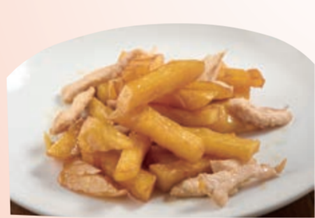
▲「橙汁地瓜」熱食時雞肉比較嫩，地瓜鬆軟，冷食時，雞肉比較硬，而地瓜比較Q，可以熱的時候吃一點，放冷些再全部吃完。