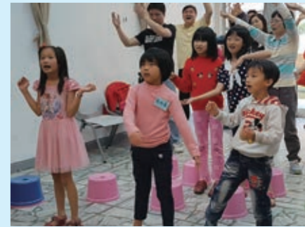
▲能歌善舞的兒童歡樂時光