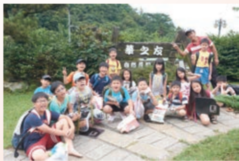
▲老闆也接受團體活動的預約，每年的暑假都與華岡財團法人基金會合作，舉辦兒童夏令營。

「炒高麗菜乾」，經過日曬的中海拔高麗菜，脆度減少，但多了一層菜乾的香味，加上熱炒，就成為色香味俱全的一道古早味料理。