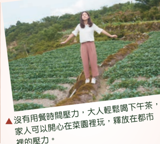
▲沒有用餐時間壓力，大人輕鬆喝下午茶，家人可以開心在菜園裡玩，釋放在都市裡的壓力。