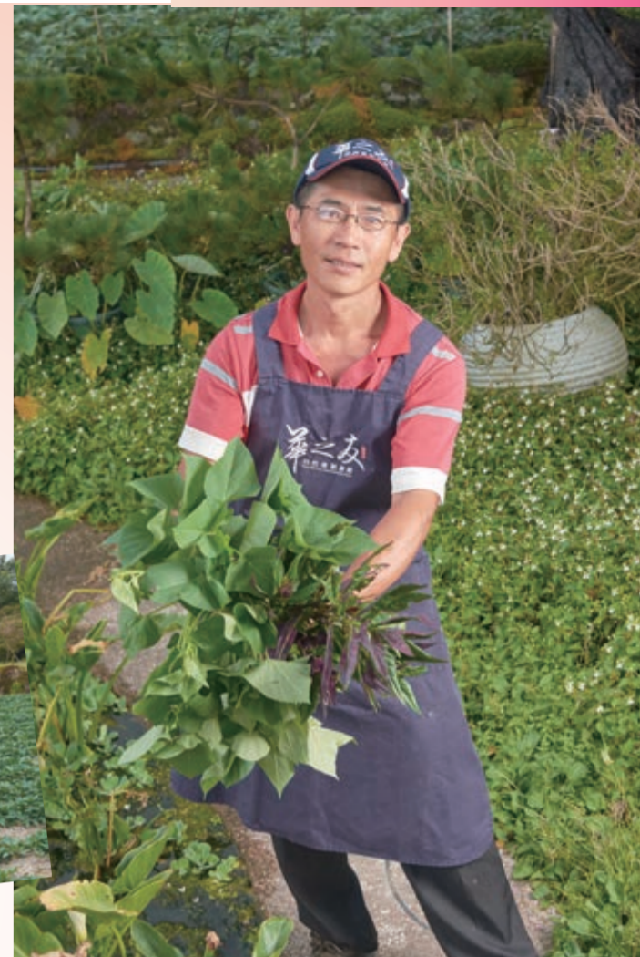
▲老闆待人和藹可親，種植的高山蔬菜很新鮮，甜度很高。