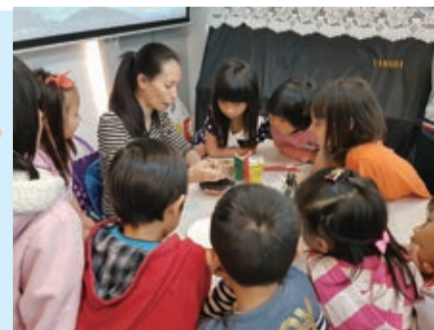
▲週末才藝班精彩的課程陪伴孩子們快樂成長。

◆萬金靈糧福音中心 ◆地址：新北市金山區中山路275號 ◆電話：(02) 2408-2635、0937-994420