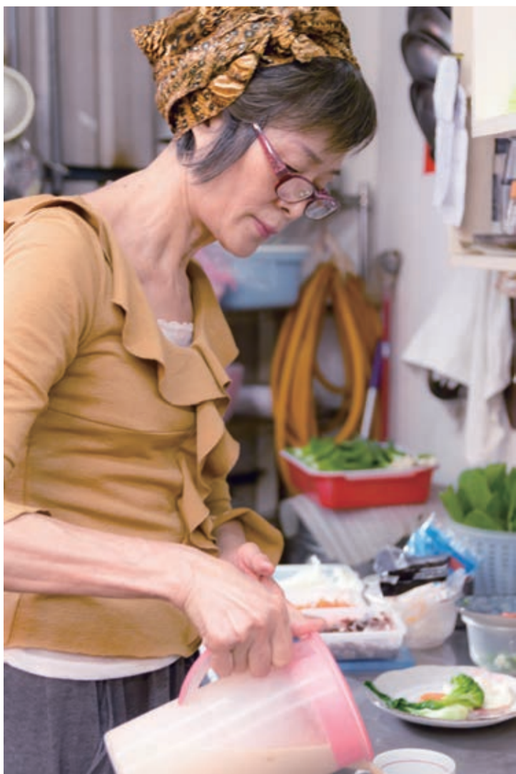
▲ 不愛吃咖哩的，來了這裡，愛上我的咖哩，不愛吃魚的，愛上我的醬燒魚。

走告，生理期間來上一碗，居然能紓緩月事帶來的不舒服。店裡還有一道不在菜單上的隱藏版私房料理「醬燒魚飯」，是許多常客推薦的老闆私房料理，整條魚好吃到盤裡一點不留（鈣質完全不流失）。需兩天前就先預約，不是每天都吃得到。在這裡很自在，就像你家裡的後廚房一樣，有滿滿的愛，不會覺得拘束，常來的熟客彼此都會成為朋友，就像不約而同的另類共食。