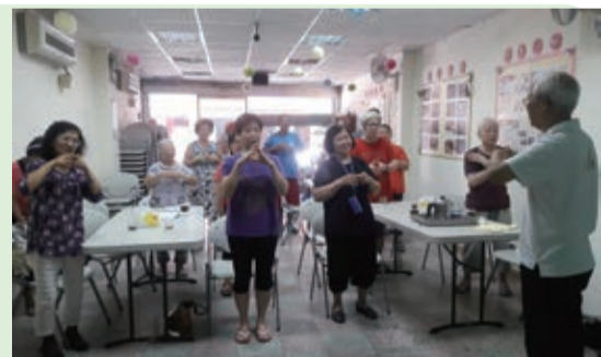
▲ 社區銀髮族養生餐會