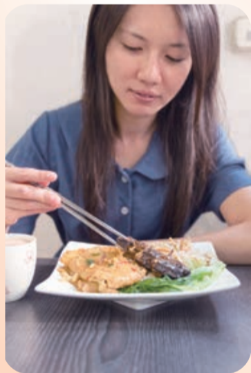
▲ 客人口中來店必點的「招牌飯」，由於熬到整隻魚入味，好吃到魚肉魚骨都可細嚼，口齒留香，客人戲稱吃到「魚也酥了，人也酥了」，滿足了饕客的味蕾。