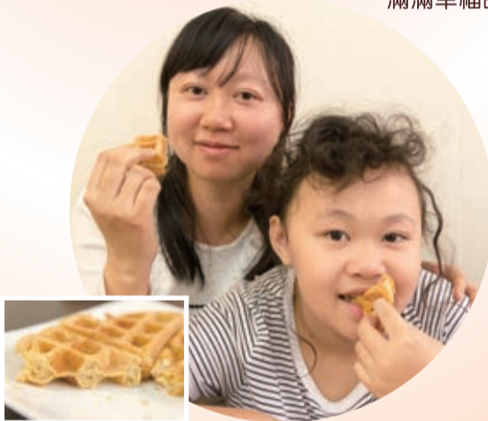
▲ 「原味鬆餅」，外皮酥脆而內裡軟，有別於一般店家賣的鬆餅，咬下去那種香味不是奶油味很重的香味，而是很純粹原味的烤麵粉香味。