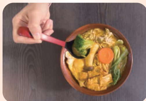
▲ 青色的蔬菜，紅色的紅蘿蔔，白色的菇類，加上吸滿金黃色咖哩汁的半熟水煮蛋和豆皮，整個畫面就很吸引人，一口喝下去有滿滿幸福的感覺。