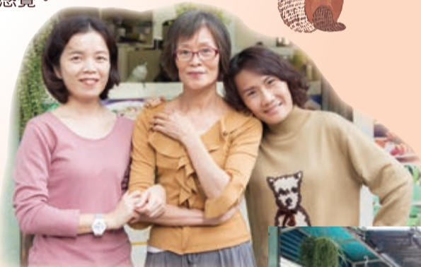
▲ 客人先是被食物吸引的，而老闆娘的平易近人也是熟客不斷上門的原因。