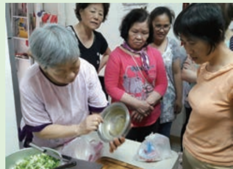
▲ 社區婦女麵食班製作湯包