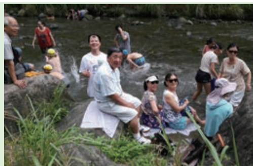
▲ 社區郊遊活動--新竹涼夏一日遊